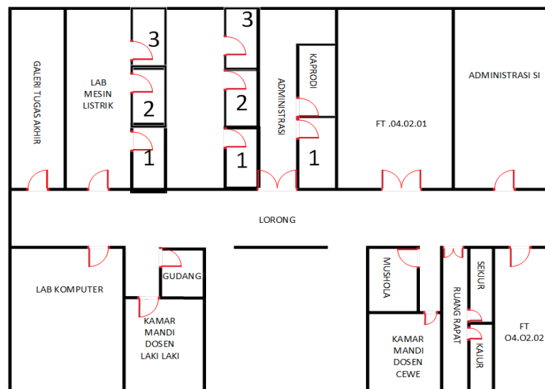
Gambar 1. Denah Lantai Satu

Setelah melakukan survei kami telah mendapatkan beberapa data dan desain ruangan pada bangunan teknik elektro universitas malikussaleh seperti ditampilkan pada gambar di bawah ini.